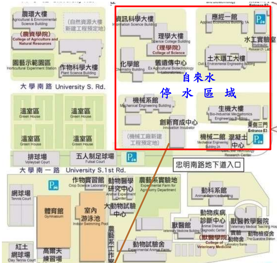
【理學大樓東側近應經一館西側階梯下自來水管線破裂施工暨停水區域示意圖】