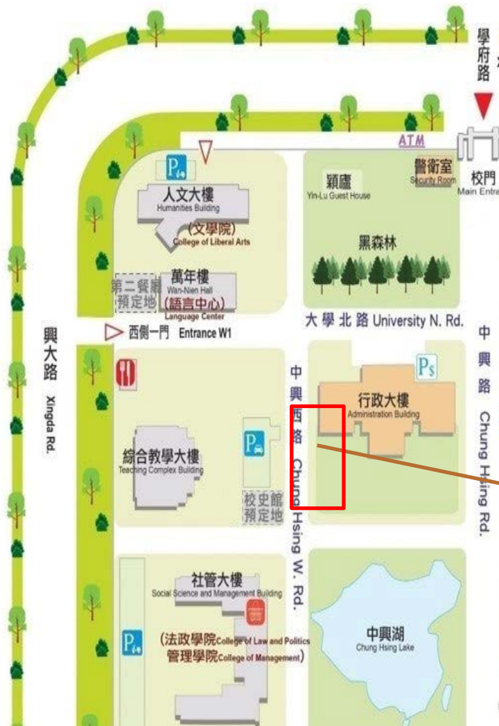
【行政大樓西側(中興西路)後方人行道道路通行管制示意圖】