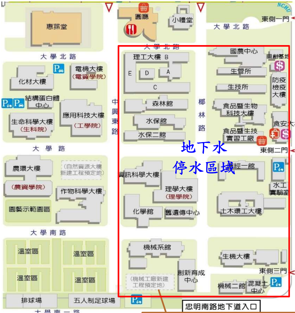
【椰林路與大學南路交叉口地地下水管線施工暨停水區域示意圖】

《緊急停水通知》※111年09月29日(四)椰林路與大學南路交叉口地下水管線破裂管線施工暨停水區域※