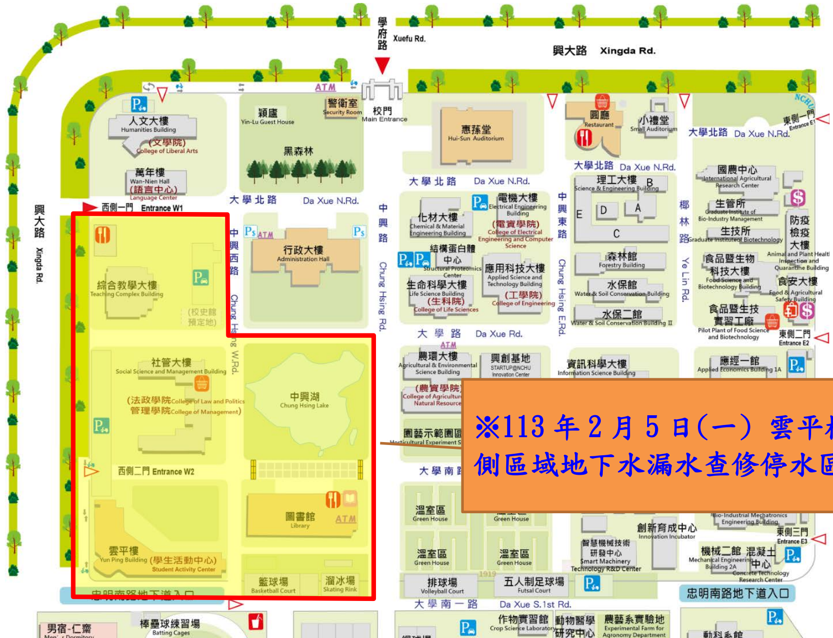
【地下水停水區域示意圖】