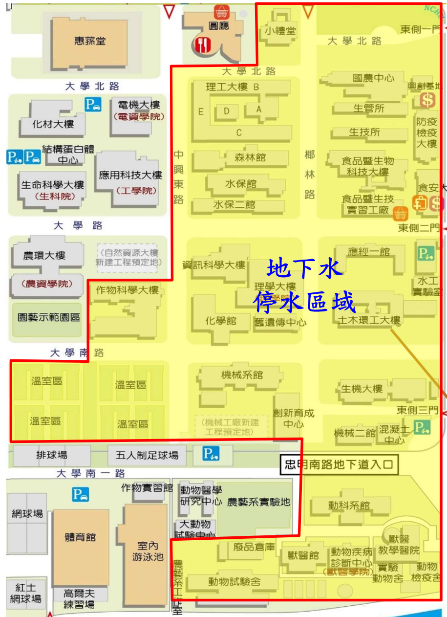
【椰林路與大學南路交叉口地地下水管線施工暨停水區域示意圖】