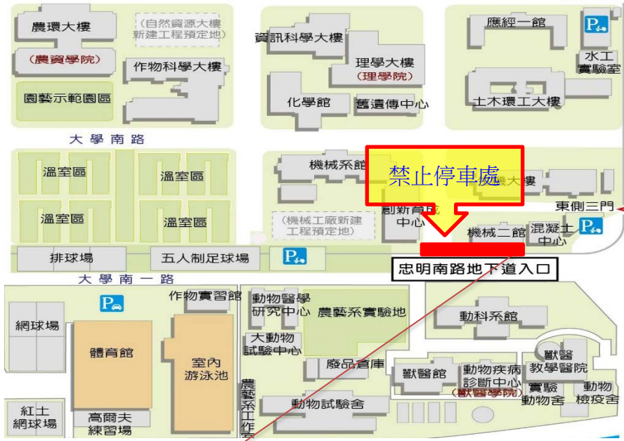
【忠明南路地下道上方部分路面下陷位置施工示意圖】