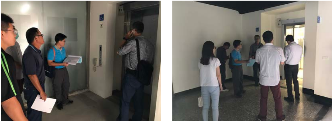
圖 1. 電梯使用驗收情況